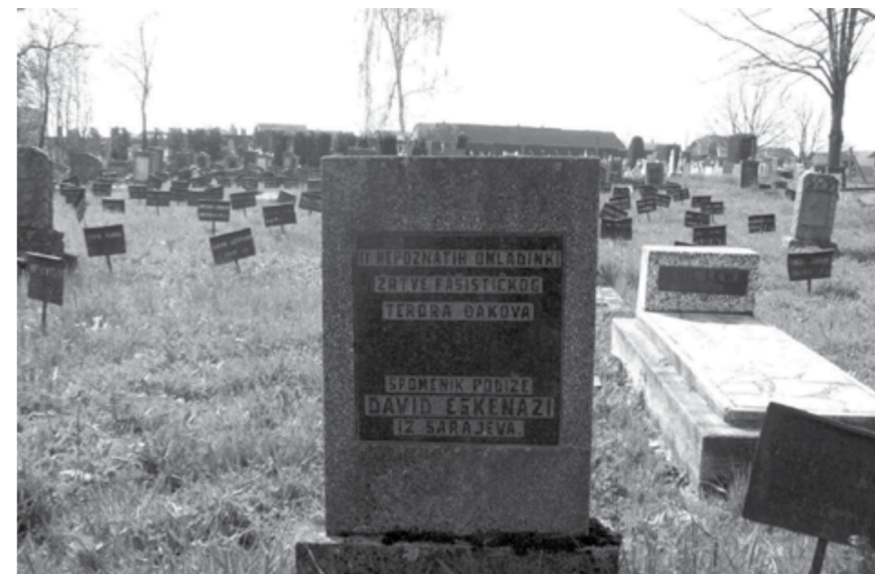
Spomenik nad zajedničkim grobom 11 djevojaka čiji su posmrtni ostaci nakon rata ekshumirani i sahranjeni na Jevrejskom groblju u Đakovu