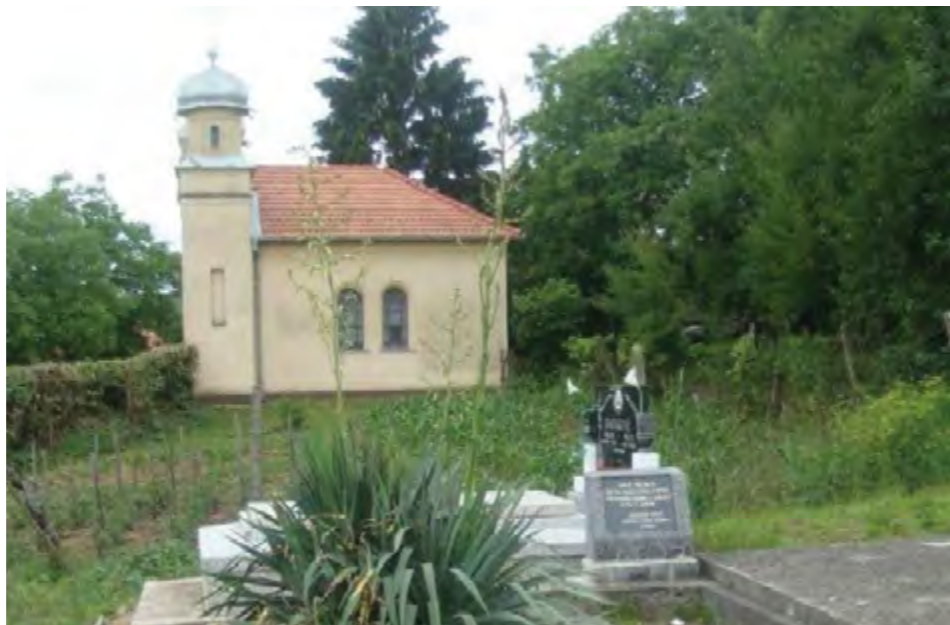
Danas u sklopu Gradskog groblja Đakovo, izvan ograde Jevrejskog groblja