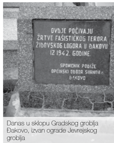
Danas u sklopu Gradskog groblja Đakovo, izvan ograde Jevrejskog groblja

(Đakovo i njegova okolica, Zbornik Muzeja Đakovštine, Đakovo 1978, knj. 1, sv. 1, str. 191).