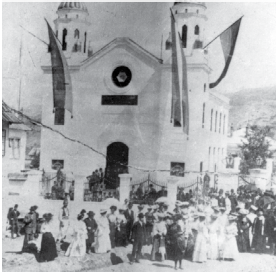
POPIS STANOVNIŠTVA 1910. g. - VIŠEGRAD