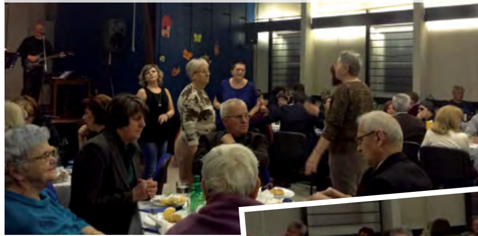
Pripremila: Klara Pelja